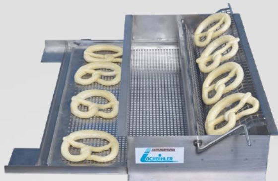
Schwabenschwenker in Arbeitsstellung

Maße (B x T x H) in mm: 550 x 610 x 121 (mit Schwenkhebel 550 x 710 x 121) Maximale Breite in Arbeitsstellung: 670 mm Schwenkgitter: 130 mm breit