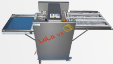
Belaugungsmaschine LoLa V3