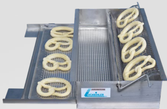
Schwabenschwenker in Arbeitsstellung

Maße (B x T x H) in mm: 550 x 610 x 121 (mit Schwenkhebel 550 x 710 x 121) Maximale Breite in Arbeitsstellung: 670 mm Schwenkgitter: 130 mm breit