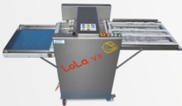
Belaugungsmaschine LoLa V3