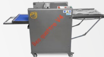
Belaugungsautomat: BEA quattro V4