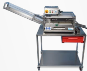
Aufschneidemaschine: Schneid-LEO Schneid-JACK