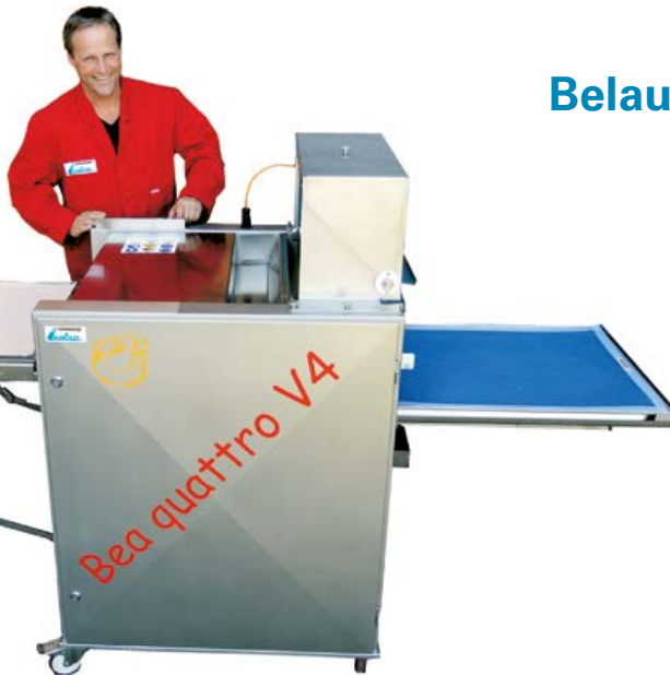
Belaugungsmaschine Bea quattro V4 Blechbelegung - 780 / 980