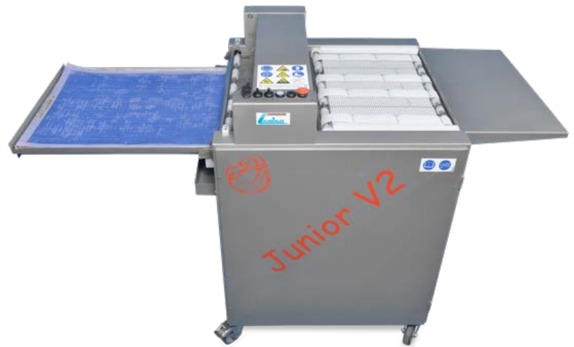
Belaugungsmaschine Junior V2 Blechbelegung 780