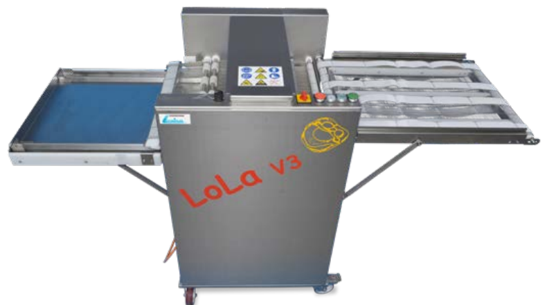
Belaugungsmaschine LoLa V3 Blechbelegung 780