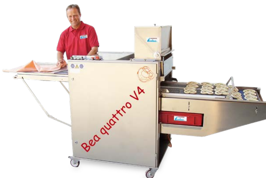
Belaugungsmaschine Bea quattro V4 SA mit separater Besatzungsvorrichtung