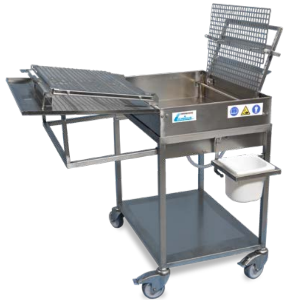
Laugentauchgerät LTG 60 x 40 / 58 x 78