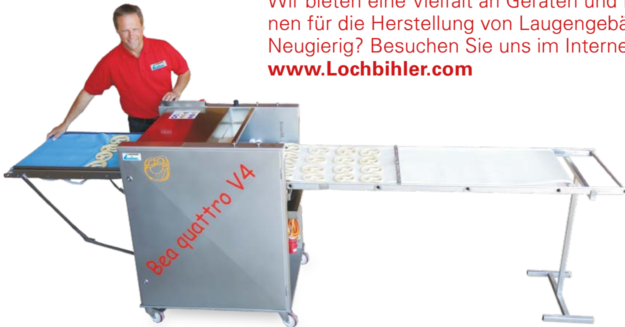
Belaugungsmaschine Bea quattro V4 KOBA Abzugs- und Blechbelegung

Wir bieten eine Vielfalt an Geräten und Maschinen für die Herstellung von Laugengebäck. Neugierig? Besuchen Sie uns im Internet unter www.Lochbihler.com