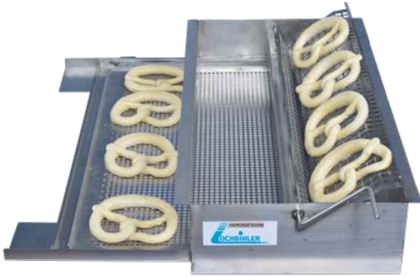
Schwabenschwenker LSS 60