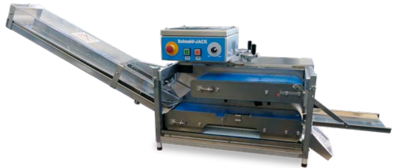
Schneid-Jack An- und Aufschneidemaschine für Kleingebäck

Lochbihler Metallverarbeitung GmbH & Co KG | Obere Mühle 8 | D-87527 Sonthofen