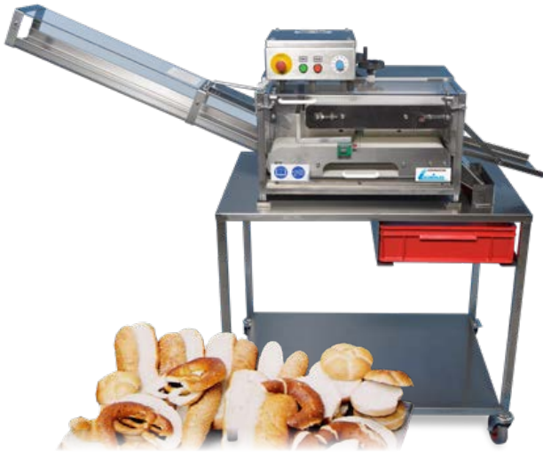
Schneid-LEO Kleingebäck- schneidemaschine