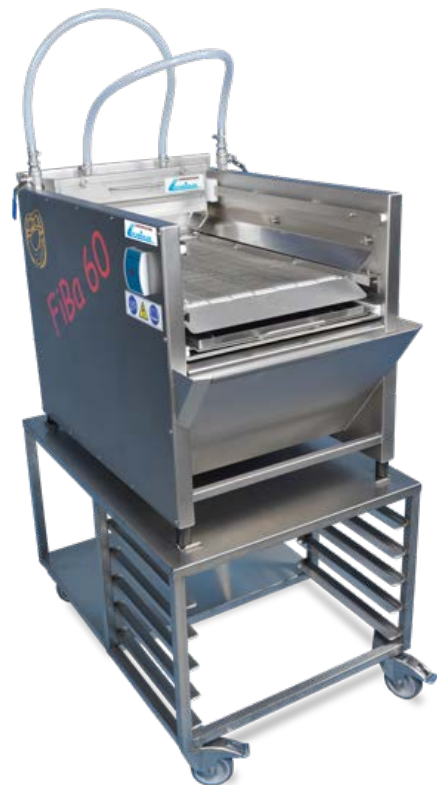
Filiabelaugung FiBa 60 x 40