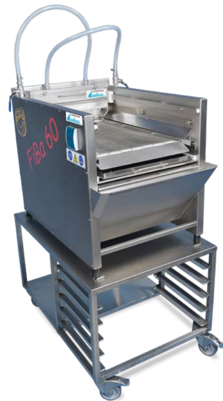
Fibalbelaugung FiBa 60 x 40