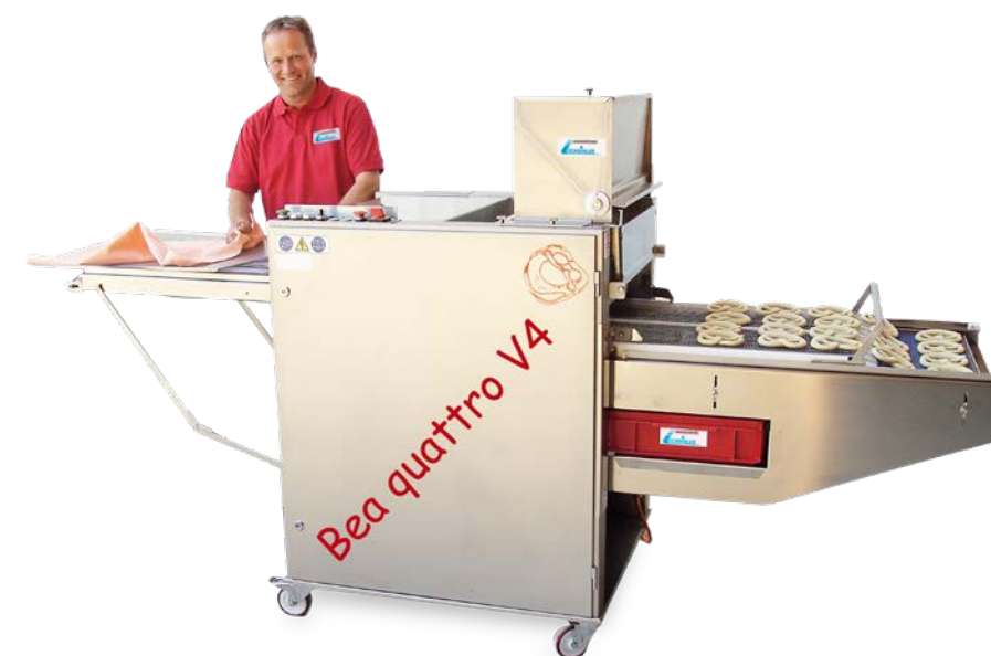
Belaugungsmaschine Bea quattro V4 SA mit separater Besatzungsvorrichtung