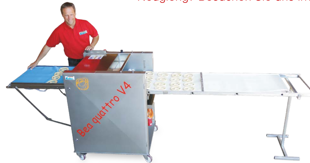
Belaugungsmaschine Bea quattro V4 KOBA Abzugs- und Blechbelegung