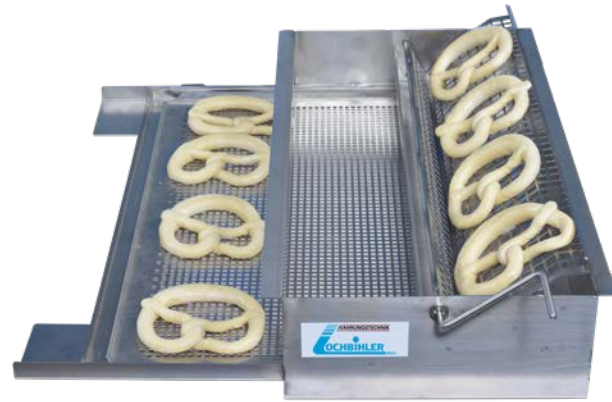
Schwabenschwenker LSS 60