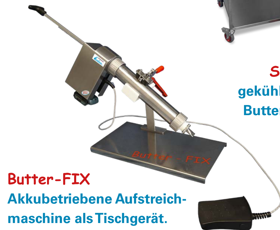
Butter-FIX Akkubetriebene Aufstreich- maschine als Tischgerät.