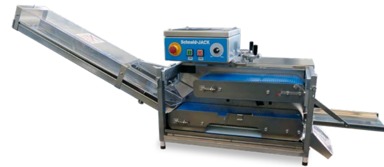
Schneid-Jack An- und Aufschneidemaschine für Kleingebäck