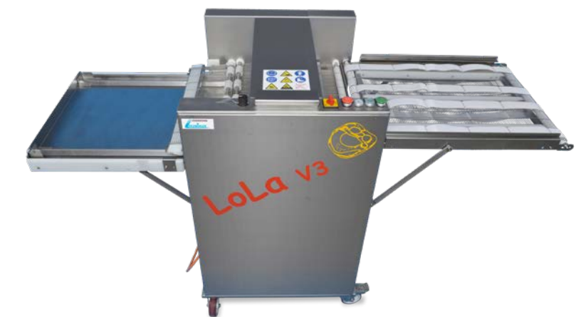
Belaugungsmaschine LoLa V3 Blechbelegung 780