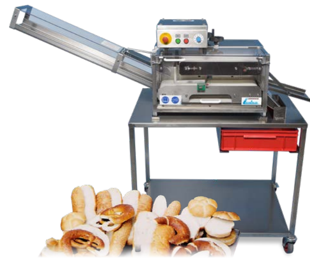
Schneid-LEO Kleingebäck- schneidemaschine