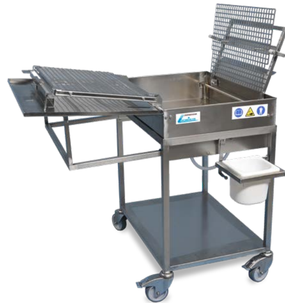
Laugentauchgerät LTG 60 x 40 / 58 x 78