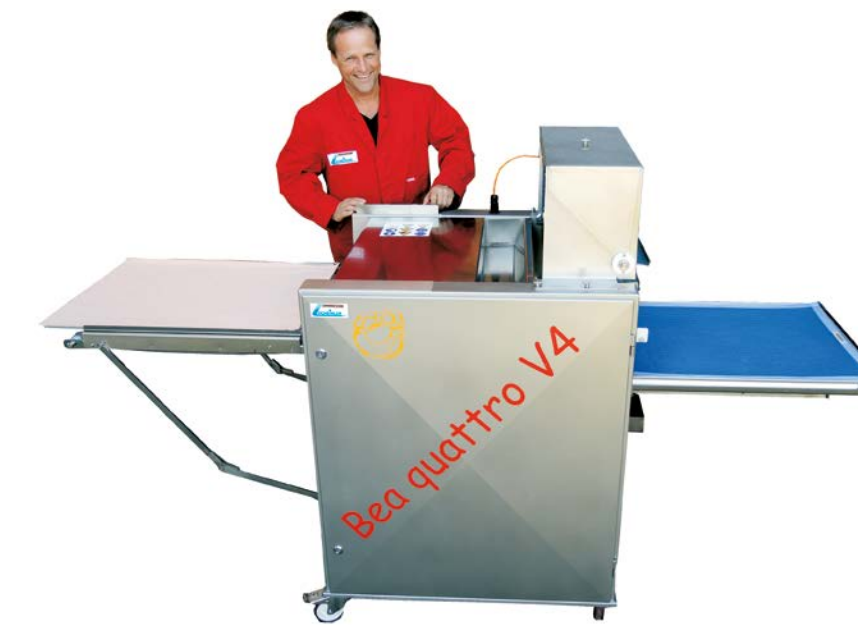
Belaugungsmaschine Bea quattro V4 Blechbelegung - 780 / 980