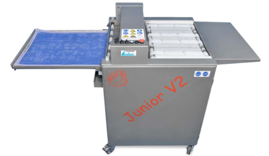
Belaugungsmaschine Junior V2 Blechbelegung 780