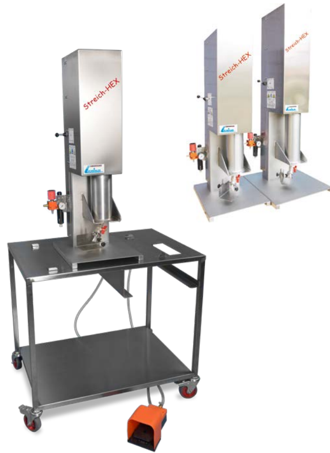
Streich-HEX gekühlte, unbehandelte Butter auf die Breze ...